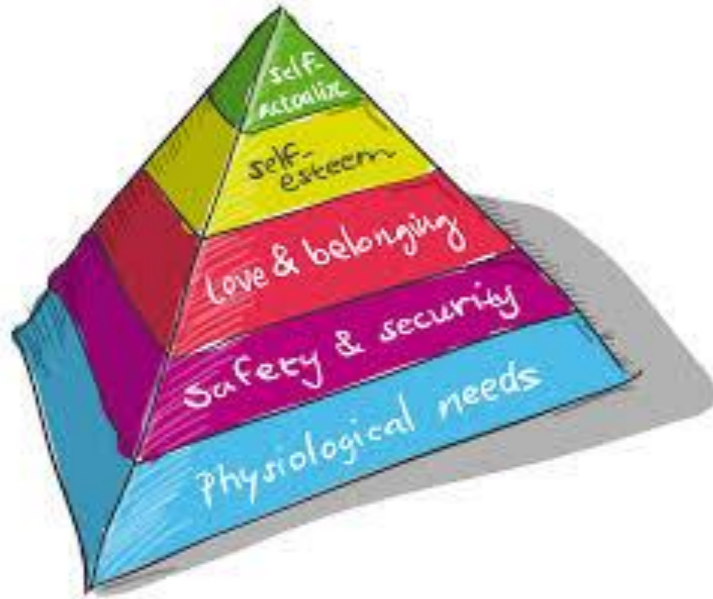
Piramide van Maslow